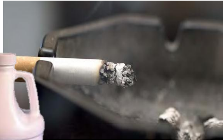
AirX 60 TODELLA VAHVA HAJUNPOISTAJA

AirX 60 on monikäyttöinen, laaja-alainen, vesiliukoinen hajunpoistaja, monta kertaa tavanomaista hajustetta voimakkaampi pitkä ikäisiin hajuhaittoihin. AirX 60 on yhdistetty AIRICIDE:n hajunpoistajan kanssa muuttaakseen hajumolekyylien muotoa tehden niistä mielekkäämpiä aisteillemme.