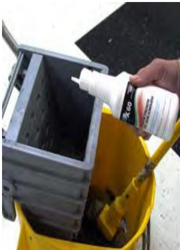
Lisää AirX 60 pesuliukokseen, matonpesuveteen.

AirX 60 toimii välittömästi epämiellyttäviin hajuihin eläimistä, ulosteista, mädäntymisestä, ruoanlaitosta, tupakasta ja tupakan savusta, alkoholista, roskista, jätteistä, maalista, kemikaaleista, jne.