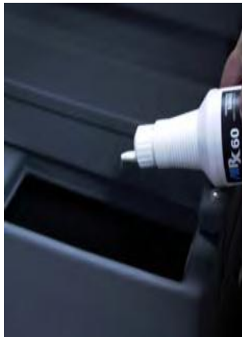
Lisää huuhteluveteen poistaaksesi pahat hajut.