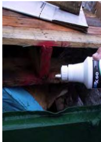
Ruiskauta suoraan jätteisiin, jätteastioihin...